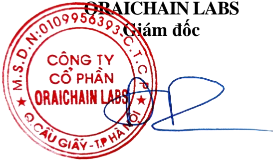
Đào Thành Chung